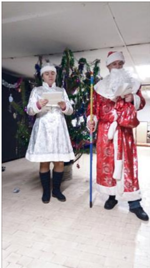
Спектакль "Калейдоскоп желаний" Новогодний концерт.