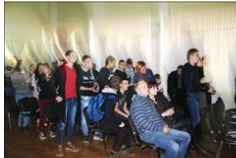
зрители. Студентам очень понравился спектакль.

Мероприятие: Показ спектакля "Мухи - Цокотухи" на Пятом международном фестивале "Нить Ариадны" для людей с особенностями психического развития в городе Москва, в киноклубе Эльдара Рязанова.