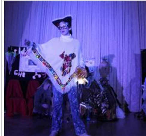
сцена из спектакля. Комарик победитель.