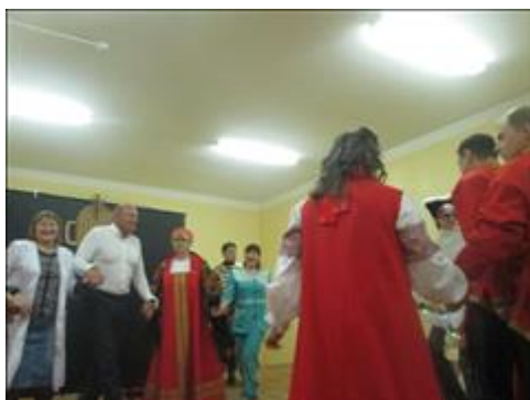
Спектакль продолжается. Совместный финал на сцене.