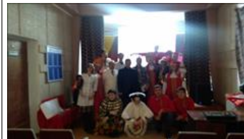
Спектакль "Мухи - Цокотухи" Финальная сцена.