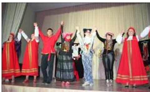
сцена из спектакля. Финал.