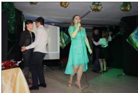
Спектакль "Калейдоскоп желаний" Сцена из спектакля.