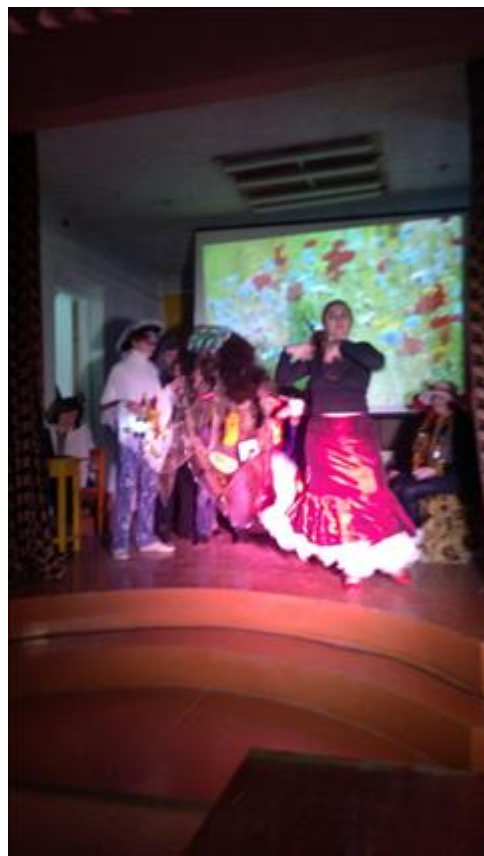
Спектакль "Мухи - Цокотухи". Сцена из спектакля

Мероприятие: Новогодний праздничный концерт со сценами из спектакля "Калейдоскоп желаний"