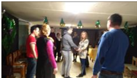
Занятие в театральной группе. Взаимодействие в парах.