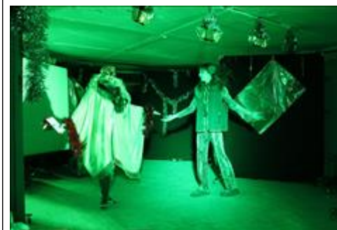
Спектакль "Калейдоскоп желаний " Сцена из спектакля.