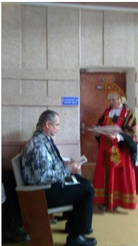
Спектакль "МУхи -Цокотухи". Презентация программки и пресрелиза для зрителей.