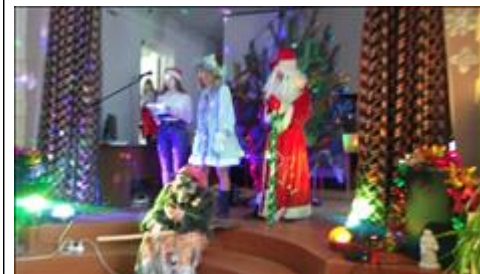
Спектакль "Калейдоскоп желаний" Новогодний концерт.

Мероприятие: Новогодний праздничный концерт со сценами из спектакля "Калейдоскоп желаний"