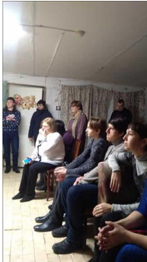
Занятие в театральной группе. Проработка материала спектакля.

Мероприятие: Проведено 60 занятий в театральной группе, участниками которой стали 65 человек: члены организации - молодые инвалиды и их родители, пациенты больницы, волонтеры, студенты техникума отраслевых технологий, педагогического колледжа и института искусств им.Рахманинова.