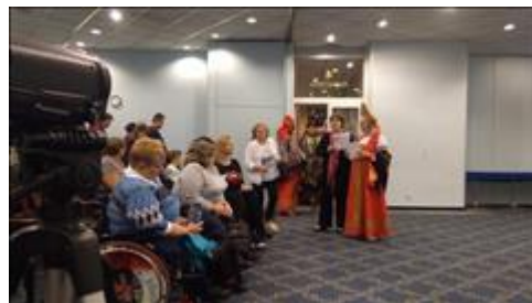
участники творческого вечера. Мы обменялись сувенирами с участниками концерта.

Мероприятие: Показ спектакля "Мухи -Цокотухи" в клубе ОГБУЗ "ТПКБ" в рамках недели, посвященной международному дню инвалидов"