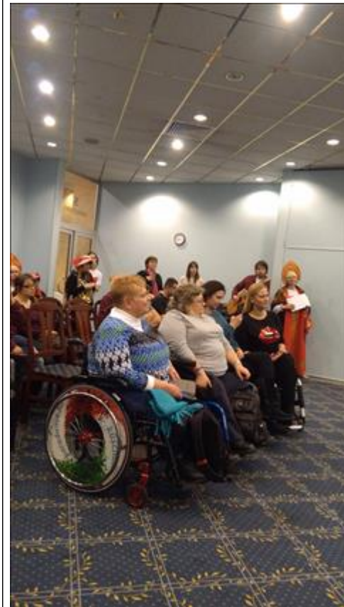
зрители. инвалиды из венгерской делегации.