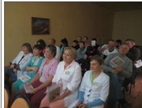
зрители. Интерес к спектаклю был неподдельный.