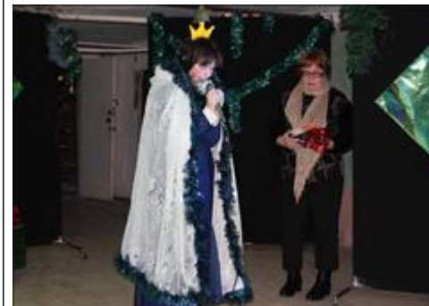
Спектакль "Калейдоскоп желаний" Сцена из спектакля.

Мероприятие: Показ спектакля "Калейдоскоп желаний" для профессионального сообщества.