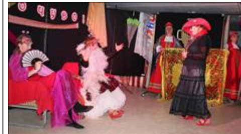
сцена из спектакля. Бабочки - красавицы в гостях у мух.