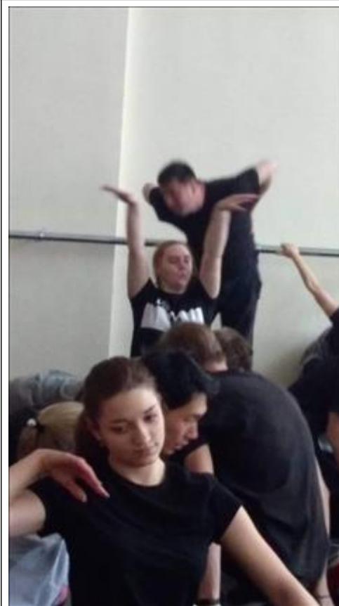
занятие в группе по ТДТ.