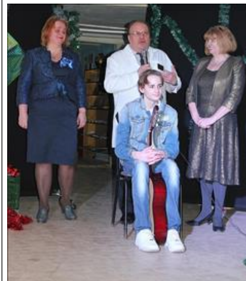
Спектакль "Калейдоскоп желаний". Первая оценка специалиста.