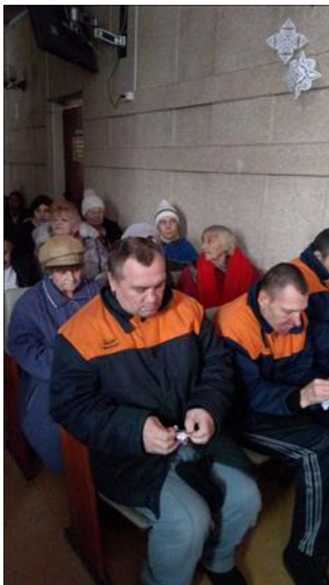
Спектакль "Калейдоскоп желаний" Концерт для пациентов больницы.

Мероприятие: Показ спектакля "Калейдоскоп желаний" для профессионального сообщества.