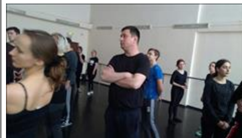
Занятие в театральной группе. Тренинг по актерскому мастерству в рамках фестиваля "Корейские вечера"

Мероприятие: Проведено 31 занятие по танцевально двигательной терапии, всего через группу по ТДТ прошли 62 человека: участники театральной группы и пациенты больницы.