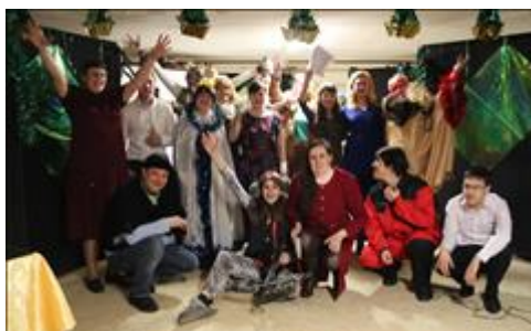
спектакль "Калейдоскоп желаний " Участники спектакля.

Мероприятие: Показ спектакля "Калейдоскоп желаний" для профессионального сообщества.