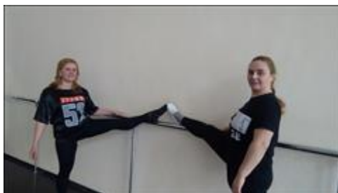
Занятия в группе по ТДТ. Семинар по сценическому танцу в рамках фестиваля "Корейские вечера"

Мероприятие: Проведено 31 занятие по танцевально двигательной терапии, всего через группу по ТДТ прошли 62 человека: участники театральной группы и пациенты больницы.