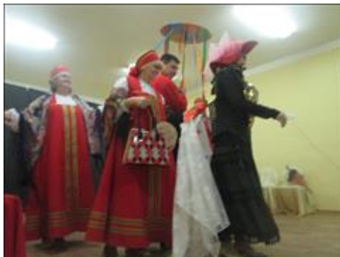
сцена из спектакля. Веселое времяпровождение.