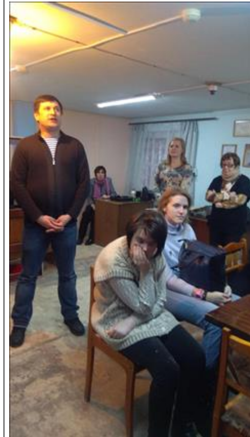
Занятие в театральной группе. Работа над речью. Читка стихов.