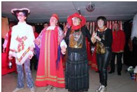
сцена из спектакля. Комарик спасает Мух - Цокотух.