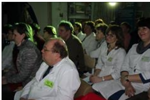
Спектакль "Калейдоскоп желаний". В зале - профессиональное сообщество.

Мероприятие: Показ спектакля "Калейдоскоп желаний" для профессионального сообщества.